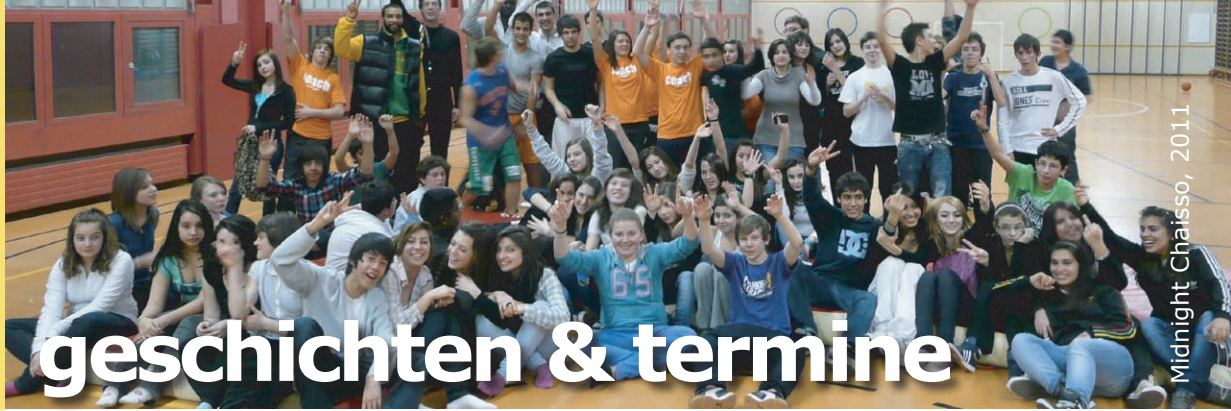
Midnight Chaisso, 2011